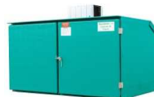
EURATAINER 6 LM