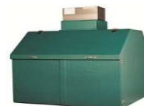
EURATAINER 2 „S”