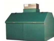
EURATAINER 6 HM