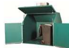
EURATAINER 4 HM